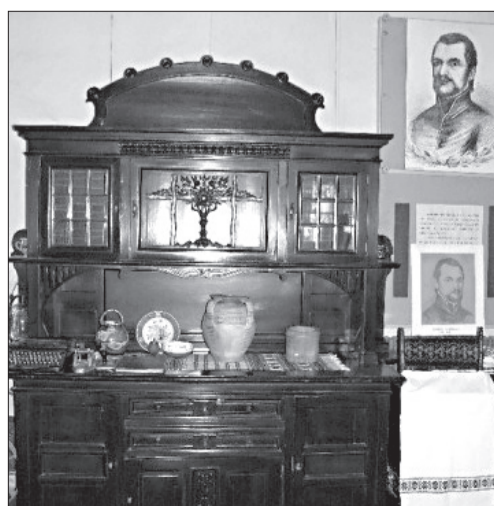
Muzeul Dimitrie Țichindeal (interior)

– Ați promis în campania electorală că veți fi primarul tuturor locuitorilor din Becicherecu Mic, indiferent de simpatiile lor politice. Cu ce ați venit concret în sprijinul oamenilor?